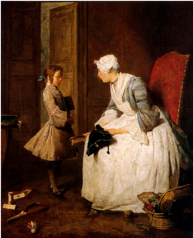
Título: La Institutriz. (The Governess – La Gouvernante) Técnica: Óleo sobre lienzo. Tamaño 46 x 37,5 cm. Año 1739. Ubicación: Galerie Nationale du Canada.