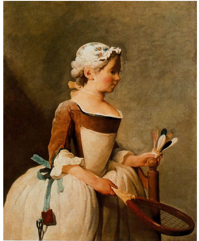
Título: Niña con raqueta y volante (Petite fille au volant dite jeune fille au volant). Técnica: Óleo sobre lienzo. Tamaño: 82 x 66 cm. Año 1740 Ubicación: Galería de los Uffizi. Florencia. Italia.