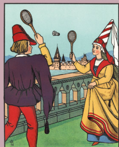
Battledore & Shuttlecock

When around the children flock, asking why called "shuttlecock," Tell the tale as of yore, "shuttlecock and Battledore," or as called by Rards of Oc, "battledore and shuttlecock."