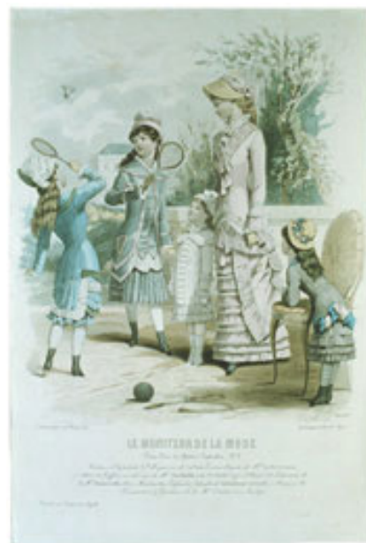
LA MODERNA DE LA MODA

When around the children flock, asking why called "shuttlecock," Tell the tale as of yore, "shuttlecock and Battledore," or as called by Rards of Oc, "battledore and shuttlecock."